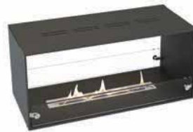
Kensington Durchsicht (FD)