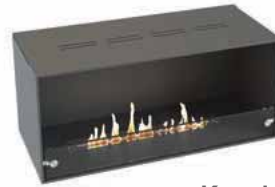
Kensington Frontöffnung (1V)